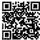
สิ่งที่ส่งมาด้วย ๒