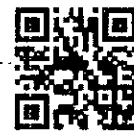
สิ่งที่ส่งมาด้วย ๔