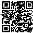
สิ่งที่ส่งมาด้วย ๓